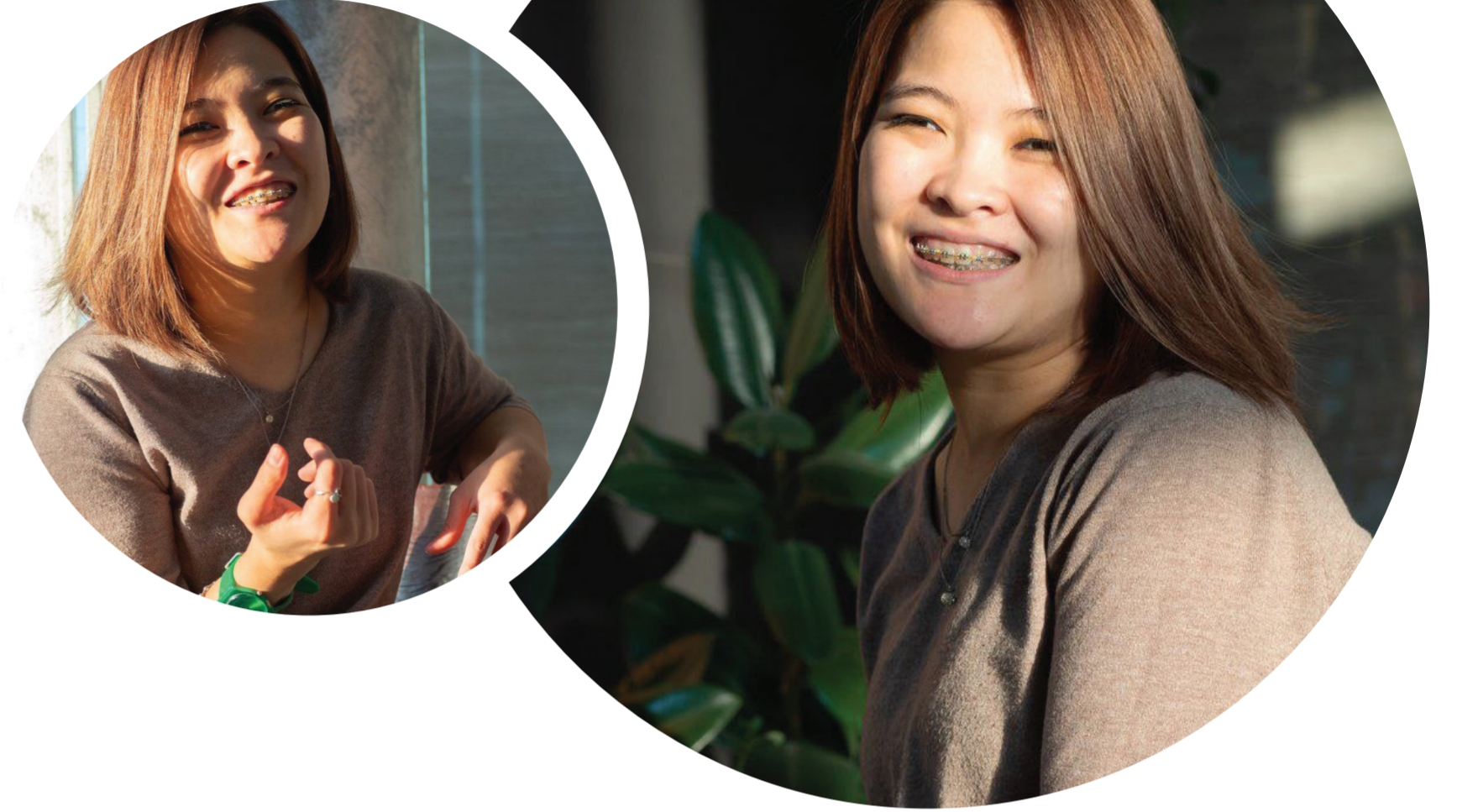
HABERİ YAZAN/ÇEVİREN: KUNDUZ ESENGULOVA

Kendi başıma yürüyebildiğim o aralarda, kardeşlerim beni daha fazla yürütebilmek amacıyla bir fikir üretmişlerdi. Ben dondurmaya çok severdim. Ağabeyim de kardeşlerime çok sevdiğim dondurmaya motivasyon aracı olarak kullanmayı önermiş. Ve artık evimizde yeni bir kural oluştu: Eğer ben dondurma yemek istersem, markete kendim