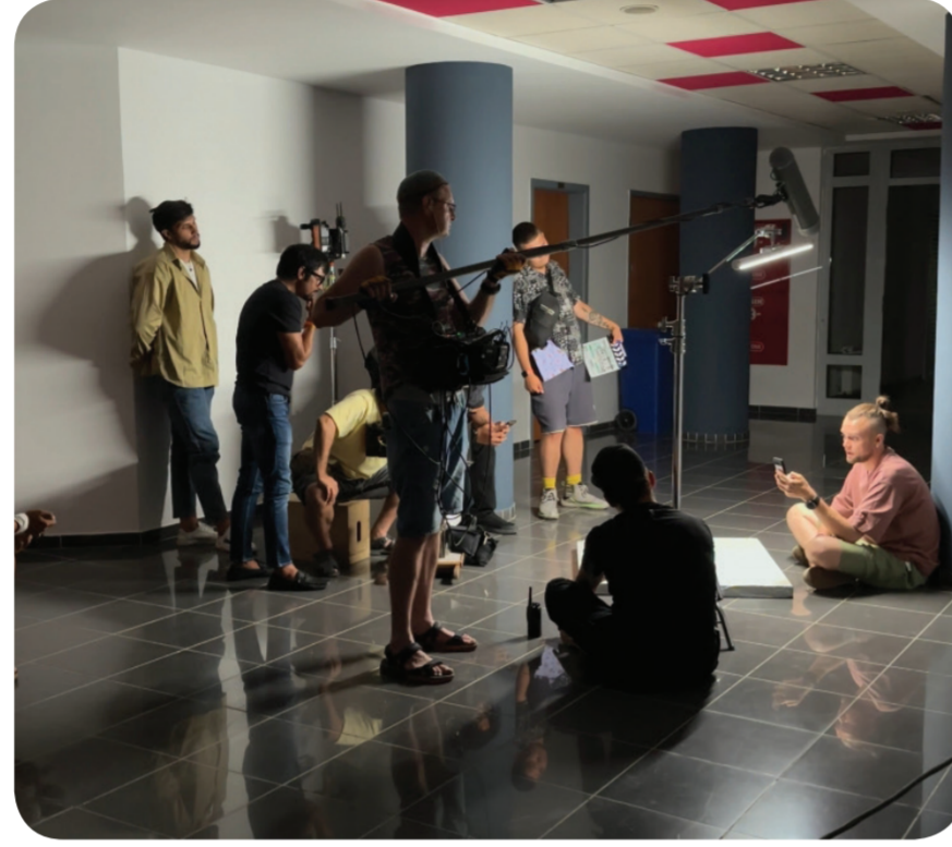
HABER: MEDIAMANAS

Üniversite içindeki çekimleri Genel Sekreterlik ve Manas Televizyonu tarafından koordine edilen filmde ağırlıklı olarak Üniversitenin açık alanları ve Oba Çay Bahçesi kullanıldı. Film güz aylarında dünya sinemalarında gösterime girecek.